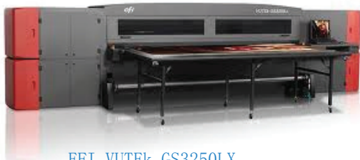
EFI VUTEk GS3250LX